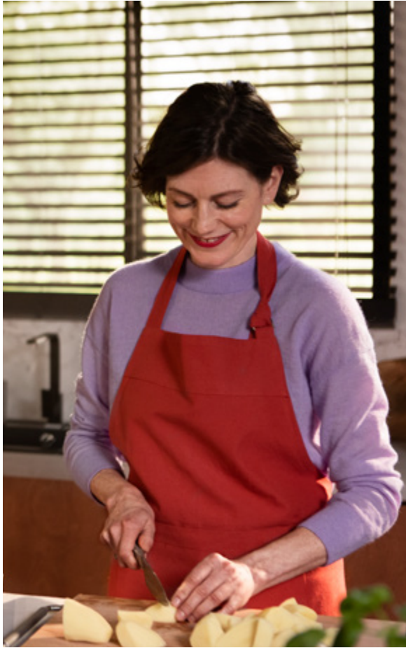
Le social cook