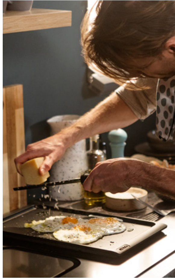
Le pleasure seeker